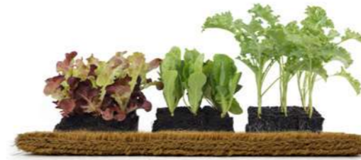
Premiati per lo zerbino Re-Birth. Fiera Ambiente, Francoforte 2023. Awarded for the Re-Birth doormat. Ambiente Fair, Frankfurt 2023.