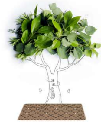
Premiati e selezionati per il tappeto Marrakech. Fiera Ambiente, Francoforte 2022. Fiera Homi Milano 2022. Selected and awarded for the Marrakech rug. Ambiente fair, Frankfurt 2023. Homi fair, Milano 2022